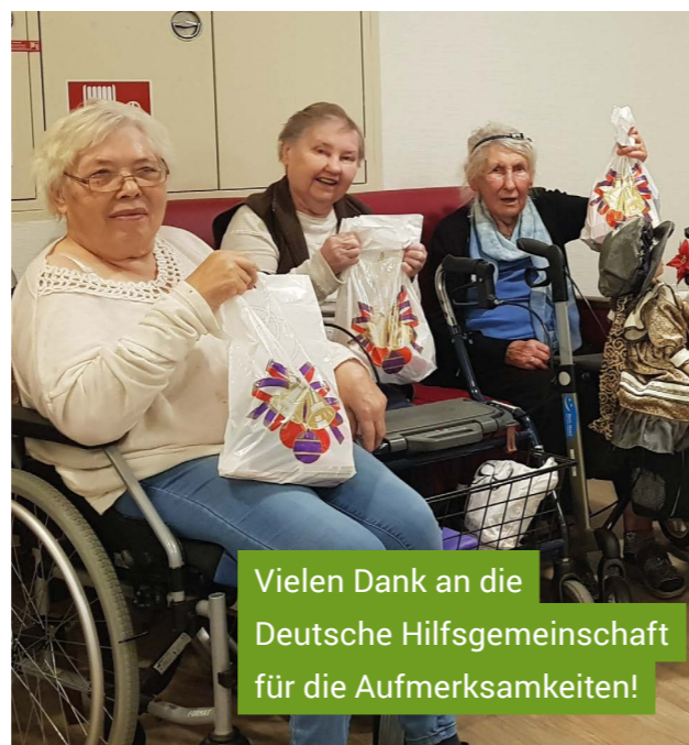
Vielen Dank an die Deutsche Hilfsgemeinschaft für die Aufmerksamkeiten!