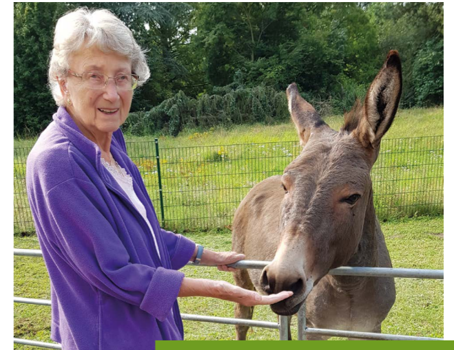
Weiche Nasen und kuscheliges Fell laden zum Streicheln ein.