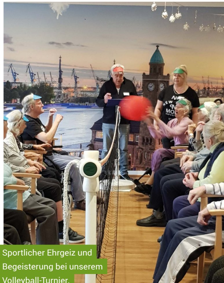
Sportlicher Ehrgeiz und Begeisterung bei unserem Volleyball-Turnier.

„Hau ihn weg!“, riefen die Teilnehmer:innen immer wieder – „Hau ihn weg!“ Gemeint war damit der große rote Ball, der natürlich am liebsten bei der gegnerischen Mannschaft den Boden berühren sollte. Am Ende siegte der Wohnbereich „Elbe“ mit vier Punkten Vorsprung und somit steht der goldene Wanderpokal nun im Wohnbereich „Elbe“. Bei der Siegerehrung erhielten alle Teilnehmenden eine glitzernde Erinnerungs-Medaille. Mit roten Wangen und in bester Stimmung gingen die Mannschaften auseinander und freuen sich schon heute auf das nächste Volleyball-Turnier im Frühjahr.