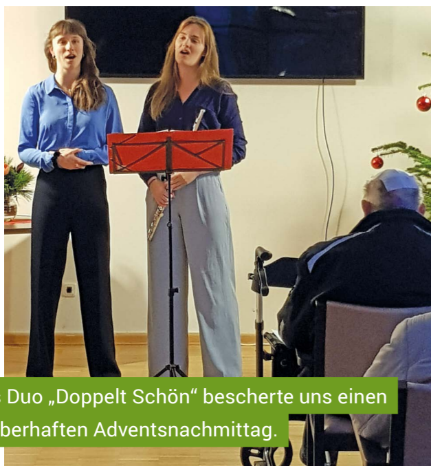
Das Duo „Doppelt Schön“ bescherte uns einen zauberhaften Adventsnachmittag.