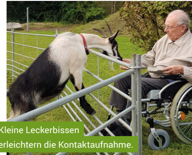
Kleine Leckerbissen erleichtern die Kontaktaufnahme.